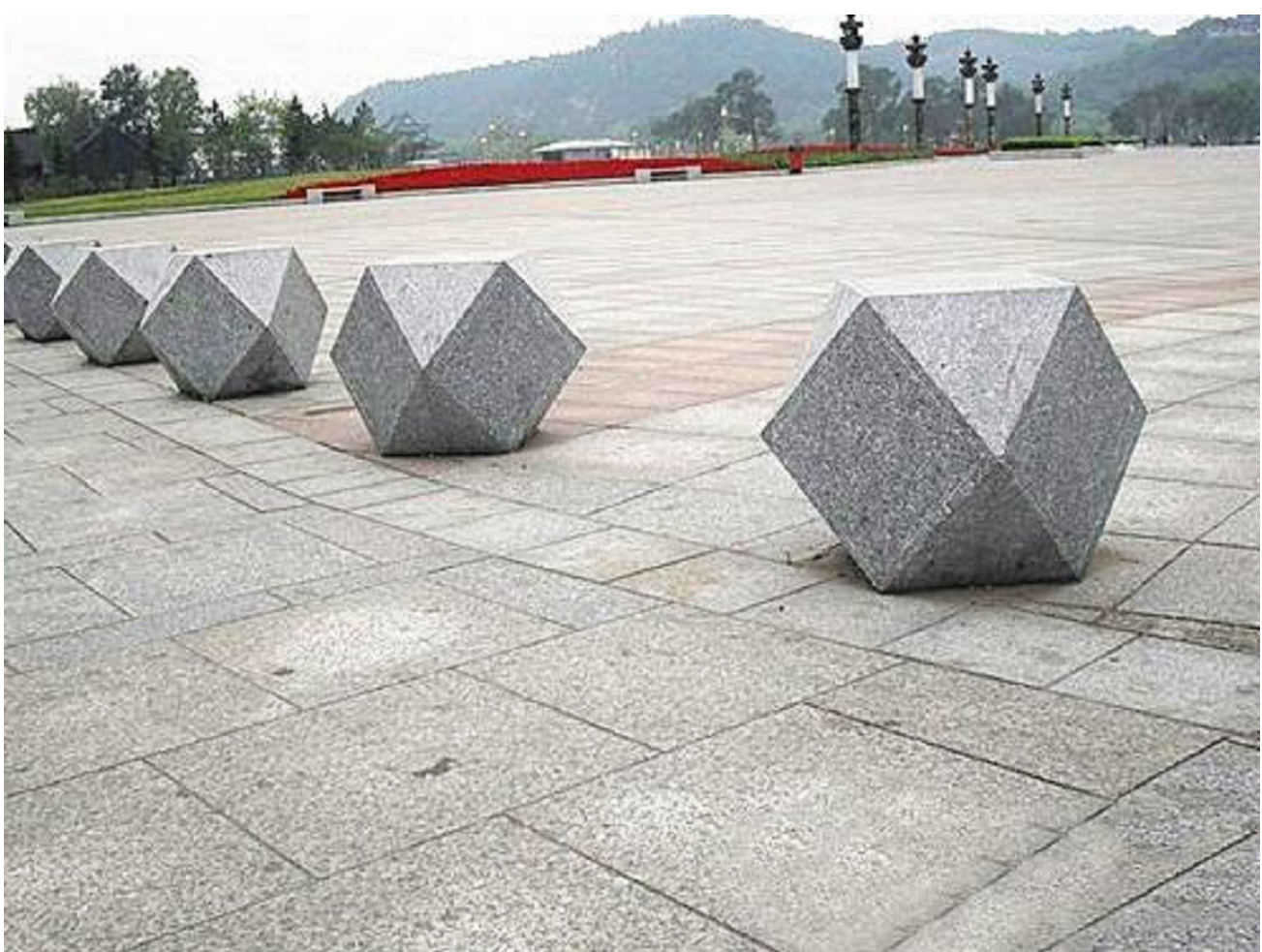
2 阻车石示意图 SCALE

注：阻车石在本次变更内容中，由物业后期根据实际情况自行摆放，上图仅为阻车石示意图。