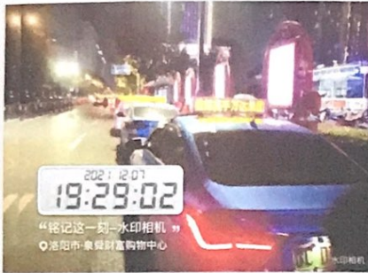
出租车 LED 广告照片