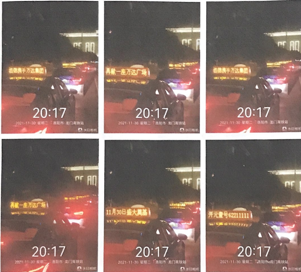
出租车 LED 广告照片