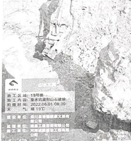
山水文苑 施工区域: 19号楼 施工内容: 集水坑底部山石破除 拍摄时间: 2022.06.01 08:30 天气: 晴 19℃ 建设单位: 四川嘉浩德康文化旅游有限公司 监理单位: 隆基工程咨询有限公司 施工单位: 河南诚鼎建设工程有限公司