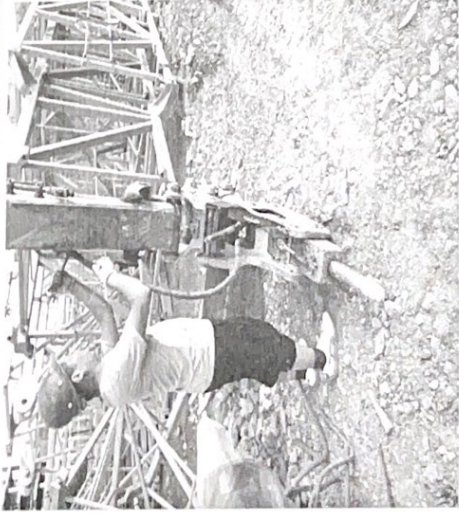
山水文苑 施工区域: 19号楼 施工内容: 集水坑底部山石破除 拍摄时间: 2022.06.01 15:28 天气: 晴 33℃ 建设单位: 四川嘉浩德康文化旅游有限公司 监理单位: 隆基工程咨询有限公司 施工单位: 河南诚鼎建设工程有限公司