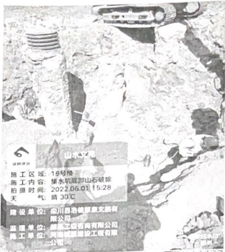
山水文苑 施工区域: 19号楼 施工内容: 集水坑底部山石破除 拍摄时间: 2022.06.01 15:28 天气: 晴 33℃ 建设单位: 四川嘉浩德康文化旅游有限公司 监理单位: 隆基工程咨询有限公司 施工单位: 河南诚鼎建设工程有限公司