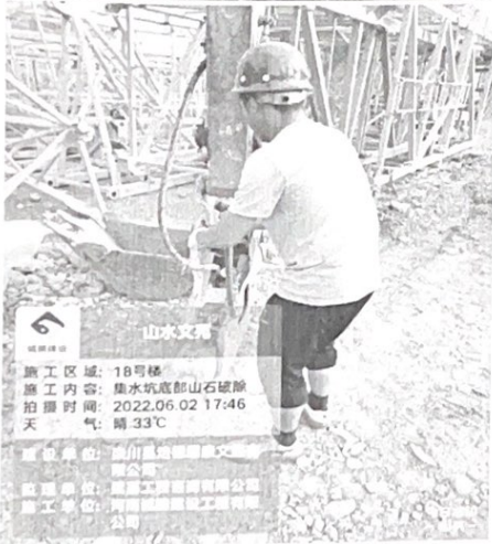
山水文苑 施工区域: 18号楼 施工内容: 集水坑底部山石破除 拍摄时间: 2022.06.02 17:46 天气: 晴 33℃ 建设单位: 四川嘉浩德康文化旅游有限公司 监理单位: 隆基工程咨询有限公司 施工单位: 河南诚鼎建设工程有限公司