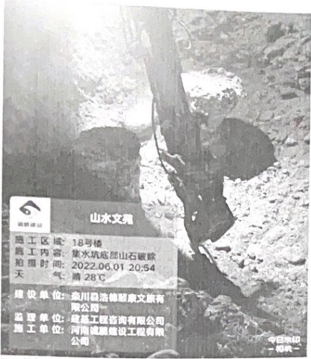
山水文苑 施工区域: 18号楼 施工内容: 集水坑底部山石破除 拍摄时间: 2022.06.01 20:54 天气: 晴 28℃ 建设单位: 四川嘉浩德康文化旅游有限公司 监理单位: 隆基工程咨询有限公司 施工单位: 河南诚鼎建设工程有限公司