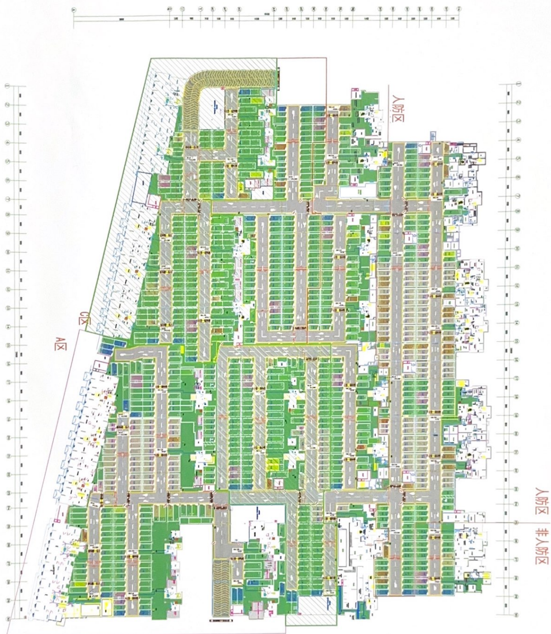
地下一层停车位提示平面图