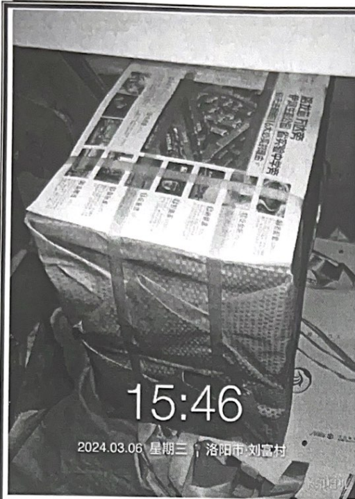
4.单页 (价值一页纸: 标准层平面图) 数量: 5000 张 制作要求: 157 克铜板纸 370*260mm 含税单价: 0.22 元 含税总价: 1100 元