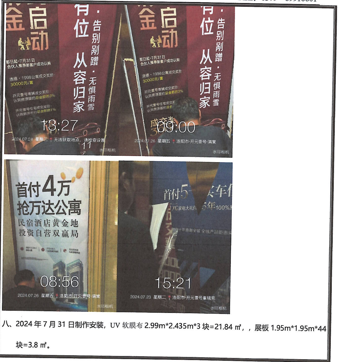
八、2024年7月31日制作安装, UV软膜布 2.99m*2.435m*3块=21.84 m 2 , , 展板 1.95m*1.95m*44块=3.8 m 2 。