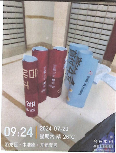
09:24 | 2024-07-20 星期六 晴 26°C 洛龙区·中浩德·开元壹号