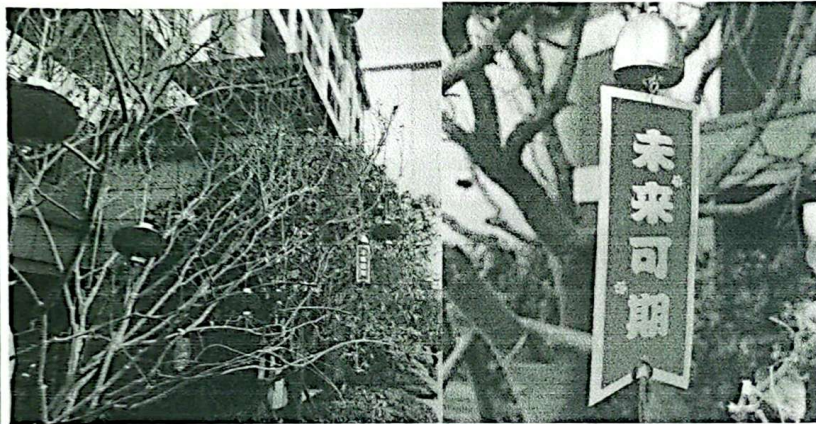
7、太阳能柿子灯一颗