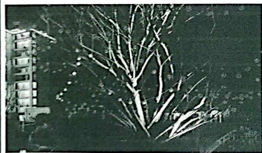
8、美陈造型、导视牌 2 组