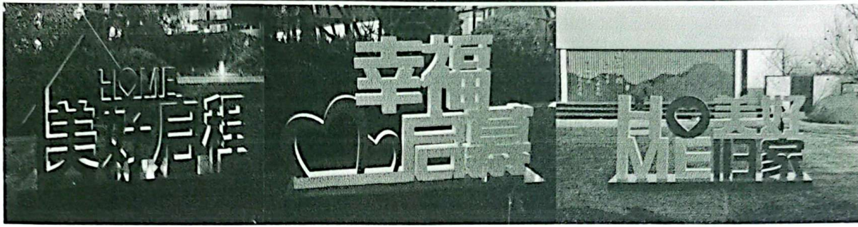
6、植绒红灯笼 1000、风车 200 个、树木卡片风铃 200 个