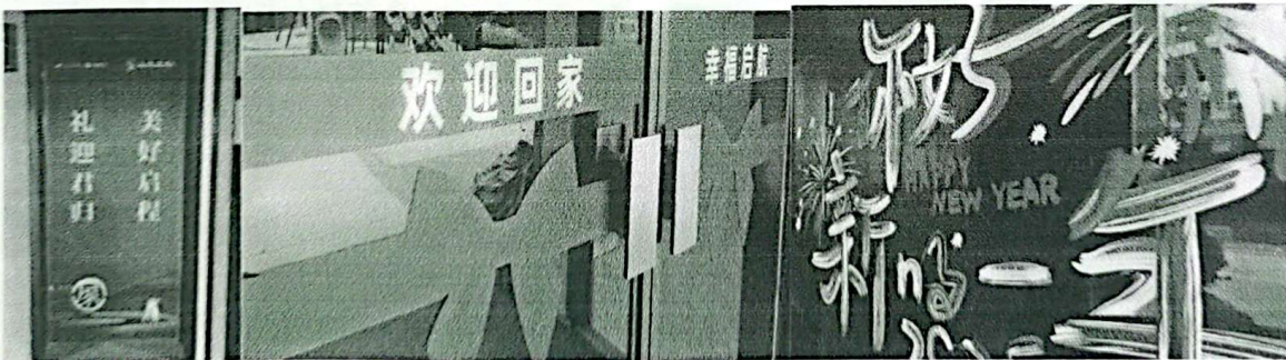
11、营销中心大门玻璃贴