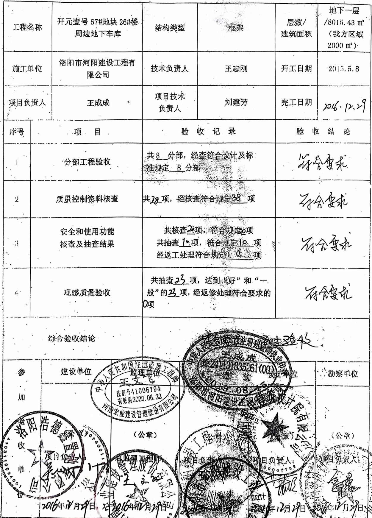
表 H. 0. 1-1 单位工程质量竣工验收记录