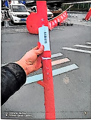
十三: KT板展架2套, KT板0.8m*1.8m*4块=5.76㎡。