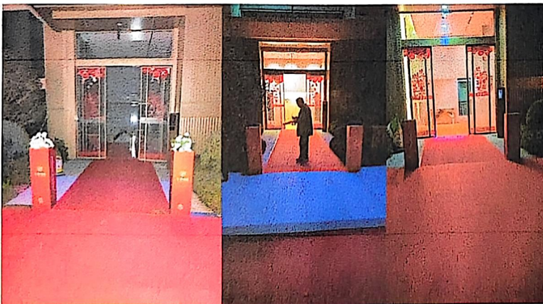
六：单元门假花 12 株。