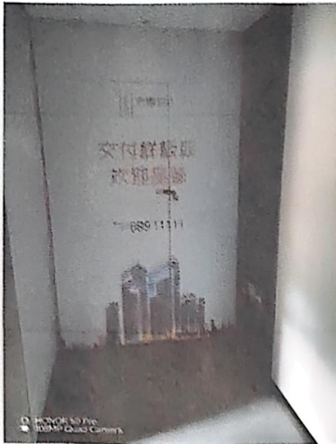
四、2025年1月9日制作安装，展板 1.8m*0.8m*1 块=1.44 m 2 ，网格布 8.4m*7.5m*1 块=63 m 2 ，12m*7.5m*1 块=90 m 2 ，网格布高空安装 5 人次，