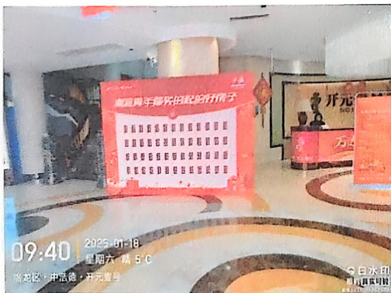
六、2025年1月16日制作安装，展板 2.7m*1.7m*1 块=4.59 m 2 ，uv 磨砂贴 0.98m*0.212m*6 块=1.25 m 2 ，物料送货费 1 次。