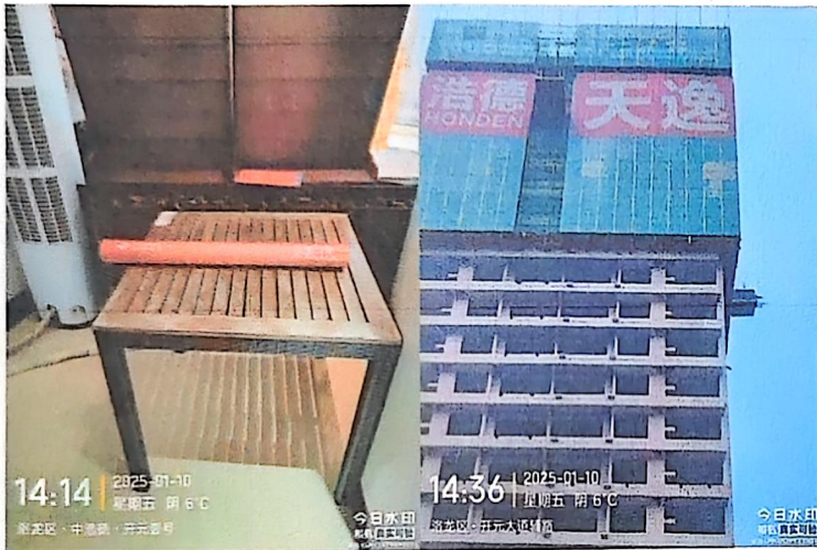
五、2025年1月14日制作安装，展板 3.7m*2.4m*1 块=8.88 m 2 ，门型展架画面 1.8m*0.8m*1 块=1.44 m 2 。