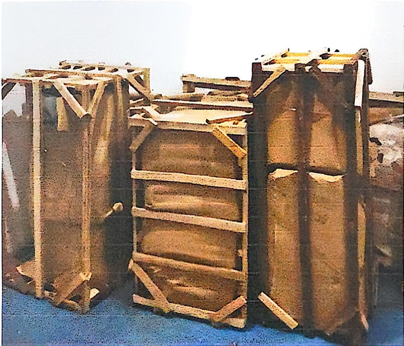
本表做为支付工程款的附件