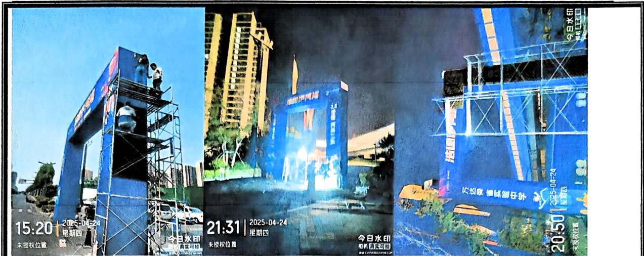
4、2025年4月25日，展板 1.2m*0.9m*2 块=2.16 m 2 ，油画展架 2 套，喷绘布 3.05m*5.05m*1 块=15.4 m 2 ，拉绒地毯 2m*5m*1 块=100 m 2 ，额外人工 2 个。