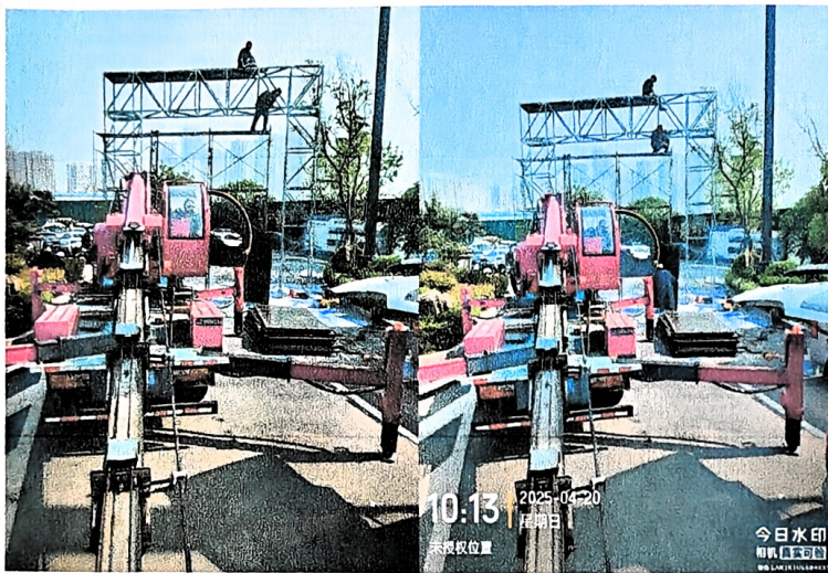
3、2025年4月21日，龙门架户外展板 203.84 m 2 ，户外写真 1.25m*9m*1 块=11.25 m 2 ，高空作业人工 7 个。