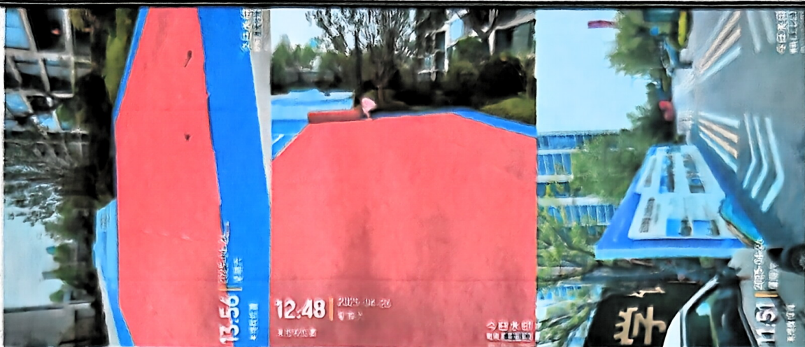
5、2025年5月10日，展板 1.8m \times 0.8m \times 1 块=1.44 m 2 ， 0.59m \times 0.79m \times 16 块=7.46 m 2 ，车贴 0.3m \times 0.4m \times 3 块=0.36 m 2 ，反光贴+异性裁切 0.3m \times 0.1m \times 190 块=5.7 m 2 ，物料送货一次。