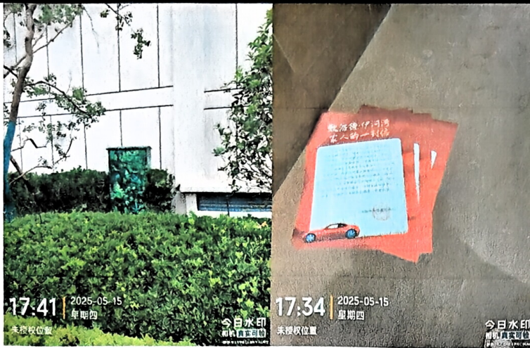
7、2025年5月22日，门型展架 0.8m*1.8m*1 套，物料送货一次。